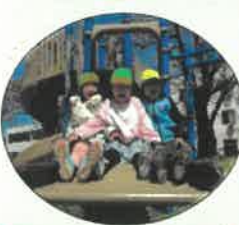
西部公園にお散歩